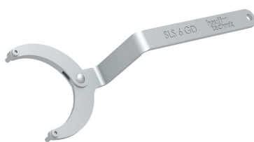
Chiave a bussola snodabile