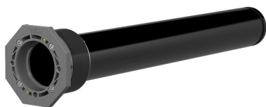
Variante di base con guarnizione interna