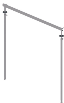
Dispositivo di montaggio