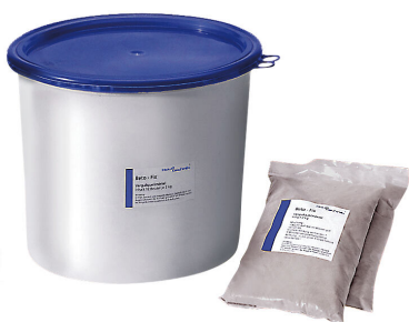
Malta di riempimento Hauff-Beto-Fix