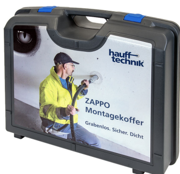
Valigetta di montaggio ZAPPO