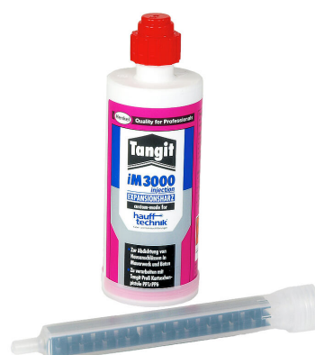
Resina bicomponente iM3000