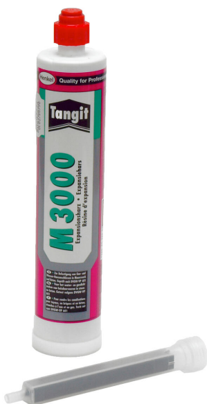
Resina bicomponente M3000