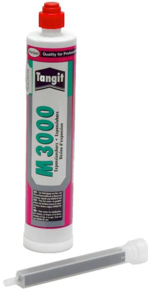
Resina bicomponente M3000