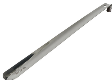
Montagepaneel voor brandbeveiligingskussens