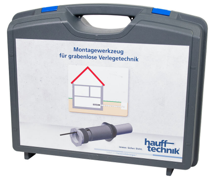
Montagekoffer MIS NoDig