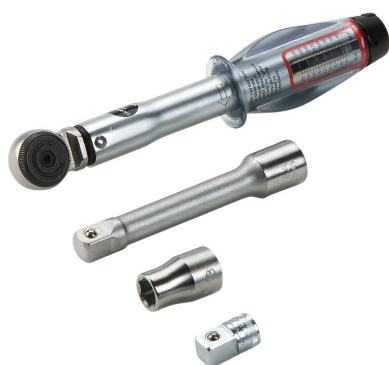
Zestaw narzędzi do montażu pokrywy KES-M