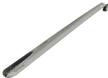
Blacha montażowa do poduszek przeciwpożarowych