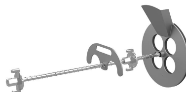
Urządzenie do wypełniania