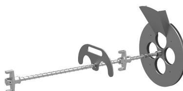
Urządzenie do wypełniania