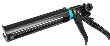
Pistolet na wkłady