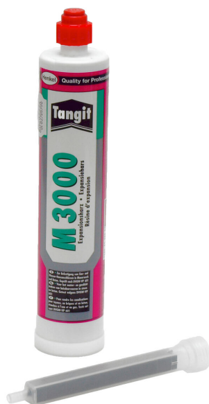
Żywica 2-komponentowa M3000