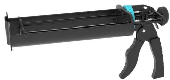
Pistolet na wkłady