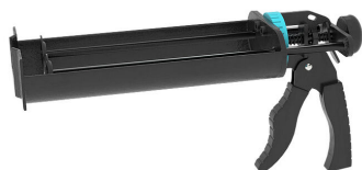
Pistolet na wkłady