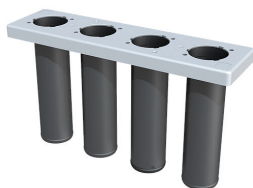
Wkład uszczelniający do elementu bazowego