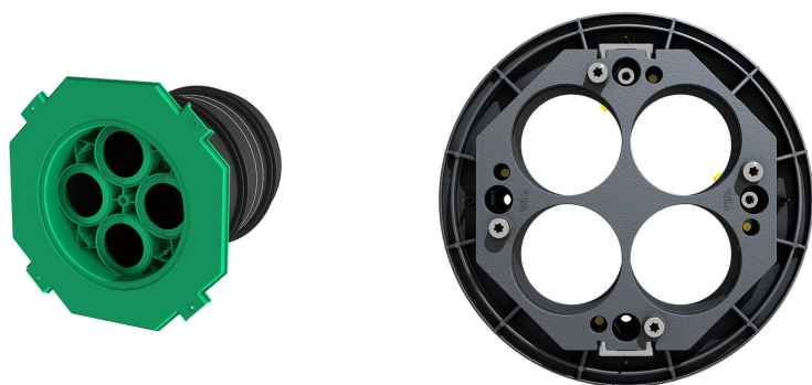
Przepust do budynków ETGAR – rura przepustowa