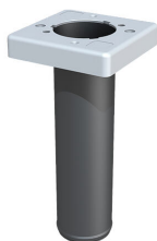
Tesnilni vložek za sestavni del gradnje v začetni fazi