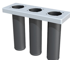
Tesnilni vložek za sestavni del gradnje v začetni fazi