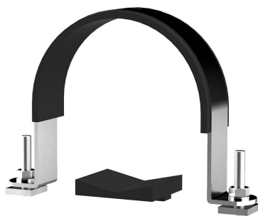
Lok za pritrjevanje