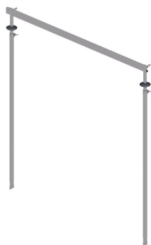
Naprava za postavljanje