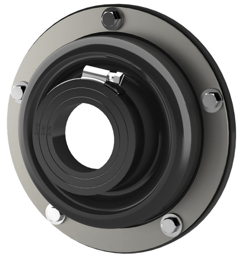
Slika se lahko razlikuje od izbranega izdelka

Za privijanje z vijaki in vložki na izvrtine, preboje ali cevne uvodnice na stenah ali privijanje pred vdolbinami v pločevinastih ohišjih. Odvisno od sistema je mogoče manšeto strokovno povezati z obstoječo zatesnitvijo kleti brez obsežnega naknadnega dela. Z istim delom se hkrati izvede zatesnitev vanj vstavljene cevi za medij.