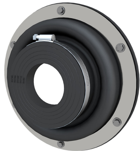
Slika se lahko razlikuje od izbranega izdelka

Za privijanje z vijaki in vložki na izvrtine, preboje ali cevne uvodnice na stenah ali privijanje pred vdolbinami v pločevinastih ohišjih. Odvisno od sistema je mogoče manšeto strokovno povezati z obstoječo zatesnitvijo kleti brez obsežnega naknadnega dela. Z istim delom se hkrati izvede zatesnitev vanj vstavljene cevi za medij.