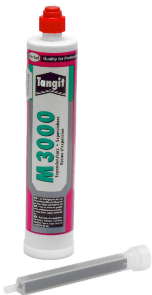
2-komponentna smola M3000