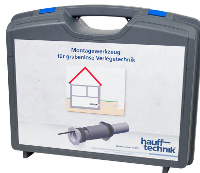
Monteringslåda MIS NoDig