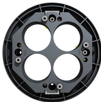
Husmodell ETGAR foderrör